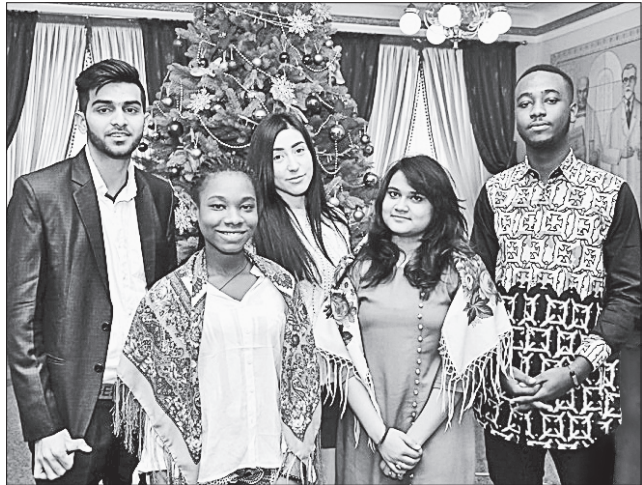
Майбутні медики чудово вжилися в новорічні образи

ПІЗНАЮЧИ ТРАДИЦІЇ. Україна колядує. Долучитися до різдвяних українських народних традицій вирішили студенти-іноземці, які обрали для навчання Тернопільський державний медичний університет ім. Івана Горбачевського. 20 слухачів підготовчого відділення з Гани, Єгипту, Руанди, Конго, Індії, Зімбабве, Південно-Африканської Республіки, Пакистану та Нігерії впродовж п'яти днів вивчили українську колядку «Добрий вечір тобі, пане господарю» та віншування й записали їх як відеопривітання всього колективу медуніверситету з нагоди Різдва Христового. Опублікували ж його на офіційній сторінці вишу у Facebook. Вони не сподівалися на такий шалений успіх. За менш ніж дві доби після появи відеозапису в соціальній мережі музичне привітання набрало 35 тисяч переглядів, 867 поширень і понад 80 тисяч охоплення. День у день ця статистика зростає. Вражає, що хлопці й дівчата з різних континентів захопилися зніманнями в українських ви-