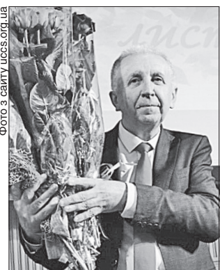
Наш колега Олександр Вертіль вміло пише історію сучасності

Торік вийшло друком друге доповнене видання «На греблі хвиль» про дворазового олімпійського чемпіона з греблі на байдарках і каное Олександра Шапаренка. А позаторік Олександр видав книжку про уславленого скорохода ХХ століття, учасника п'яти олімпіад, володаря чотирьох олімпійських нагород сумчанина Володимира Голубничого «20 кілометрів до триумфу».