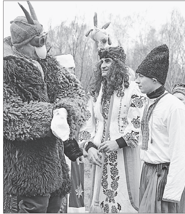
Меланкування передбачає перевдягання жінкою парубка-жартівника

З 6 на 7 січня — Святвечір. Готуючись до цього обрядового дійства, слід дотримуватися давніх традицій: не беріть нічого в борг, щоб не обсіли нестатки впродовж року; якщо мали з кимось сварку чи непорозуміння — залагодьте вибаченням і взаємопрощенням. На Святвечір збирається вся родина, а також запрошують на гостину самотніх сусідів. На столі має бути дванадцять пісних страв. Приблизно такі: кутя з медом та розтертим маком, борщ із грибами, млинці (їдять із борщем), голубці, риба заливна, риба смажена, вінегрет, вареники з вишнями, каша пшоняна або гречана, пиріжки з горохом, капуста, тушкована на олії, узвар. Окремо ставлять дві тарілки, біля яких ніхто не сідає: одна для душ померлих родичів, друга — для відсутніх членів сім'ї.