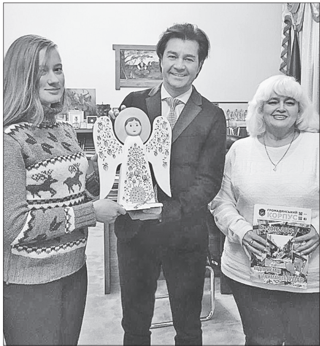
Міністра культури Євгена Нищука вразила історія двох фігурок зі згорілого будинку в Рубіжному. Він подарував свого ангела в музей