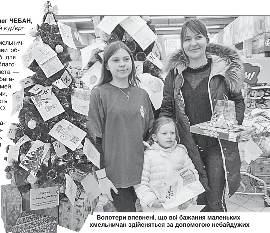
Волонтери впевнені, що всі бажання маленьких хмельничан здійсняться за допомогою небайдужих

За умовами акції, всі листи, написані дітьми, прикріплюють до новорічної ялинки. Волонтери запрошують усіх небайдужих громадян здійснити маленьку мрію дитини. Тож хмельничани і гості міста, завітавши до торговельного центру «Оазис», можуть допомогти здійснити новорічні та різдвяні бажання малечі, чий батьки або особи, які їх замінюють, не можуть цього зробити через складні життєві обставини. Як зазначено на сайті ОДА, подарунки, зібрані під час акції, передають кожній дитині особисто.