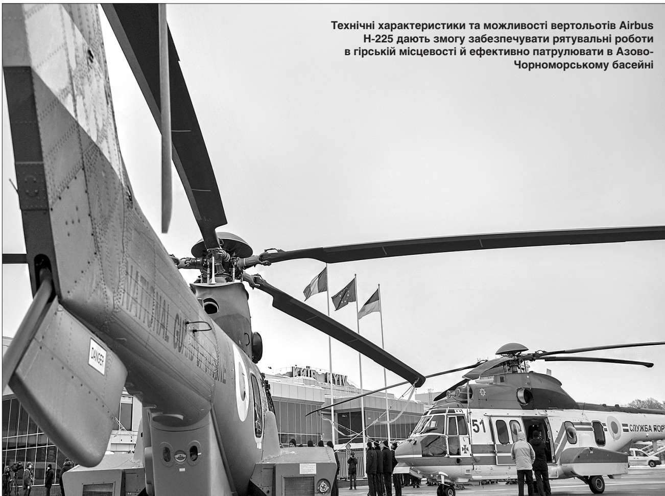
Технічні характеристики та можливості вертольотів Airbus H-225 дають змогу забезпечувати рятувальні роботи в гірській місцевості й ефективно патрулювати в Азово-Чорноморському басейні