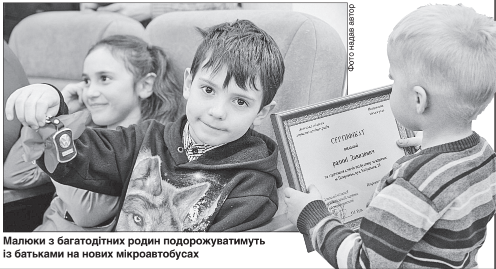
Малюки з багатодітних родин подорожуюватимуть із батьками на нових мікроавтобусах

край. Дякую всім громадам, які докладують зусиль для забезпечення дітей житлом і підтримують багатодітні родини», — прокоментував голова Донецької обласної державної адміністрації Олександр Куць.