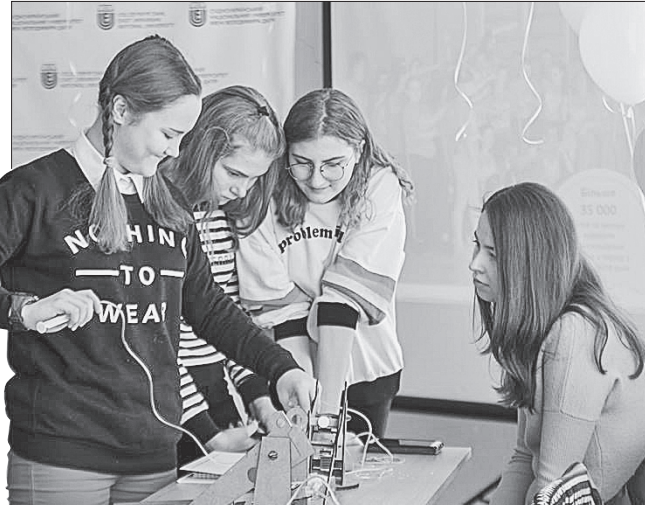
У новітній майстерні молодь зможе втілювати креативні ідеї

ТЕХНОЛОГІЇ — МОЛОДИМ. Інноваційне середовище облаштовано у переміщеному Східноукраїнському національному університеті імені В. Даля. У Fabrication Laboratory (FabLab) діти та молодь, які постраждали внаслідок збройного конфлікту, зможуть працювати разом, розвивати навички та матеріалізувати власні ідеї в будь-якій галузі — від освіти до мистецтва та науки. Інноваційне середовище відкрили завдяки співпраці з Фондом Terre des hommes у межах проекту «Спільне реагування України IV», що фінансує міністерство закордонних справ Нідерландів.