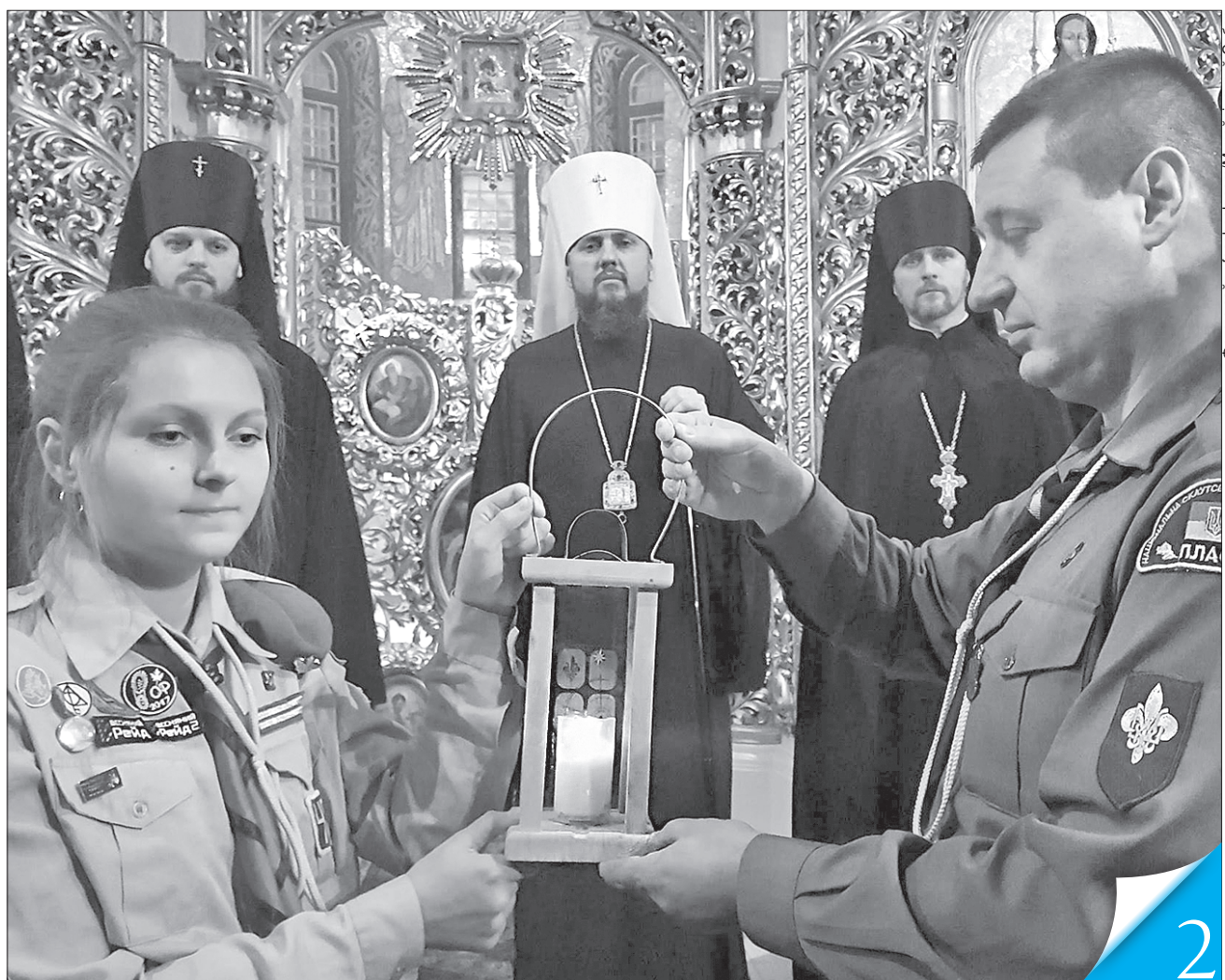
Митрополиту Київському та всієї України Епіфанію українські пластуни передали Вифлеємський вогонь — символ миру, любові і єдності

НАРЕШТІ! Всеукраїнський православний об'єднавчий собор виправдав сподівання мільйонів вірян і здійснив історичну мрію нашого народу