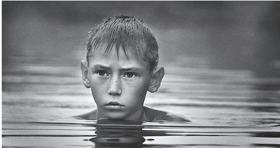
Головний герой фільму — десятирічний житель прифронтового села

Зйомки фільму тривали протягом 2015—2017 років у селі Гнутове на Донеччині, а прем'єра відбулася торік у листопаді. За рік «Віддалений гавкіт собак» встиг зібрати 20 нагород на кінофестивалях у всьому світі, зокрема головний приз фестивалю документального кіно в Амстердамі, головний приз студентського журі Docudays-2018 в Україні, спеціальну нагороду