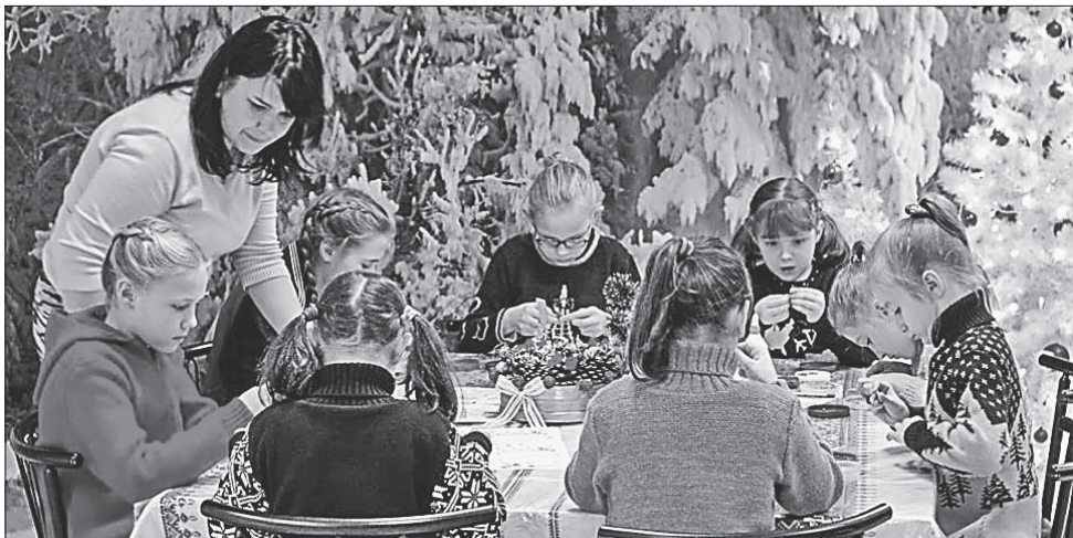
У резиденції святого Миколая можна і листа чудотворцю надіслати, і таланти свої показати