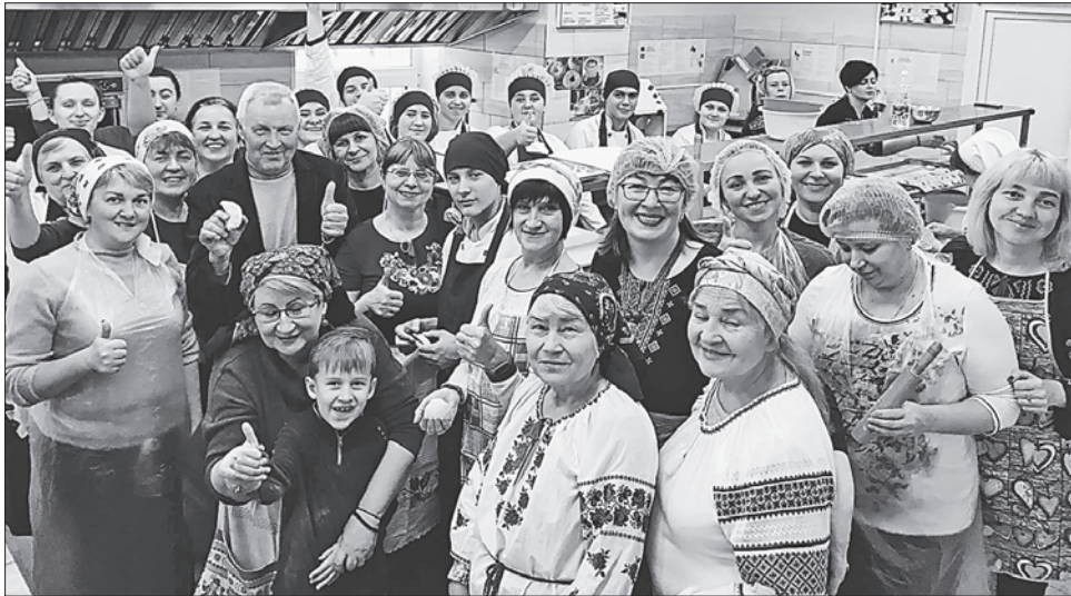
«Вареники для бійців зробили!» — кажуть матері