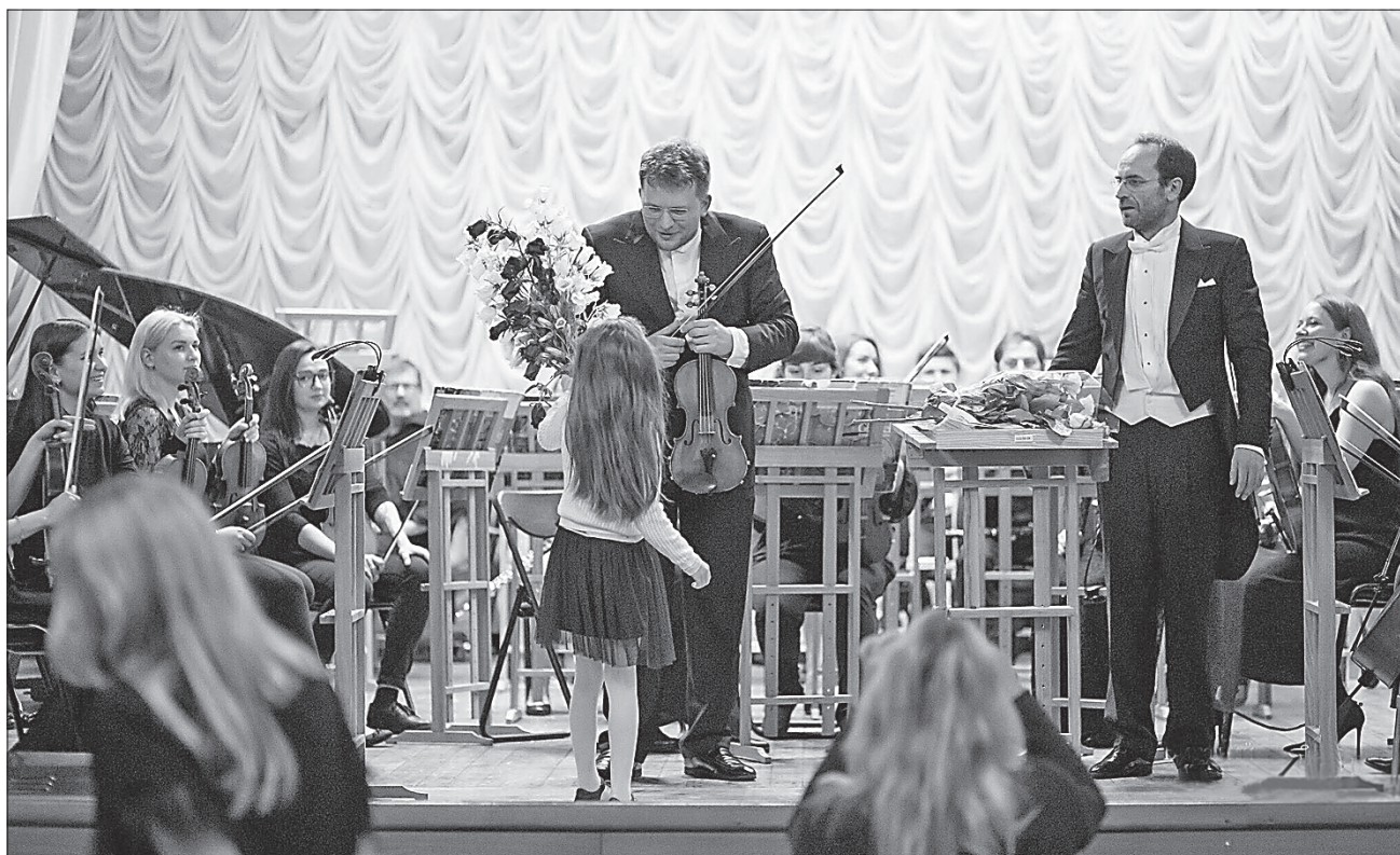
XXV Міжнародний фестиваль виконавської майстерності «Музика — наш спільний дім» завершив роботу, щоб наступного року знову запалити серця харків'ян чарівними звуками музики

За час роботи школа підготувала понад 2000 музикантів. Серед її випускників — діячі мистецтва зі світовими іменами: піаністи Володимир Крайнев та Данило Крамер, композитори Лев Колодуб та Олександр Щетинський, диригент Аллін Власенко, художній керівник Національної філармонії України Володимир Лукашов та багато інших. Свого часу цей навчальний заклад закінчили музиканти, відомі в музичних колах Харкова.