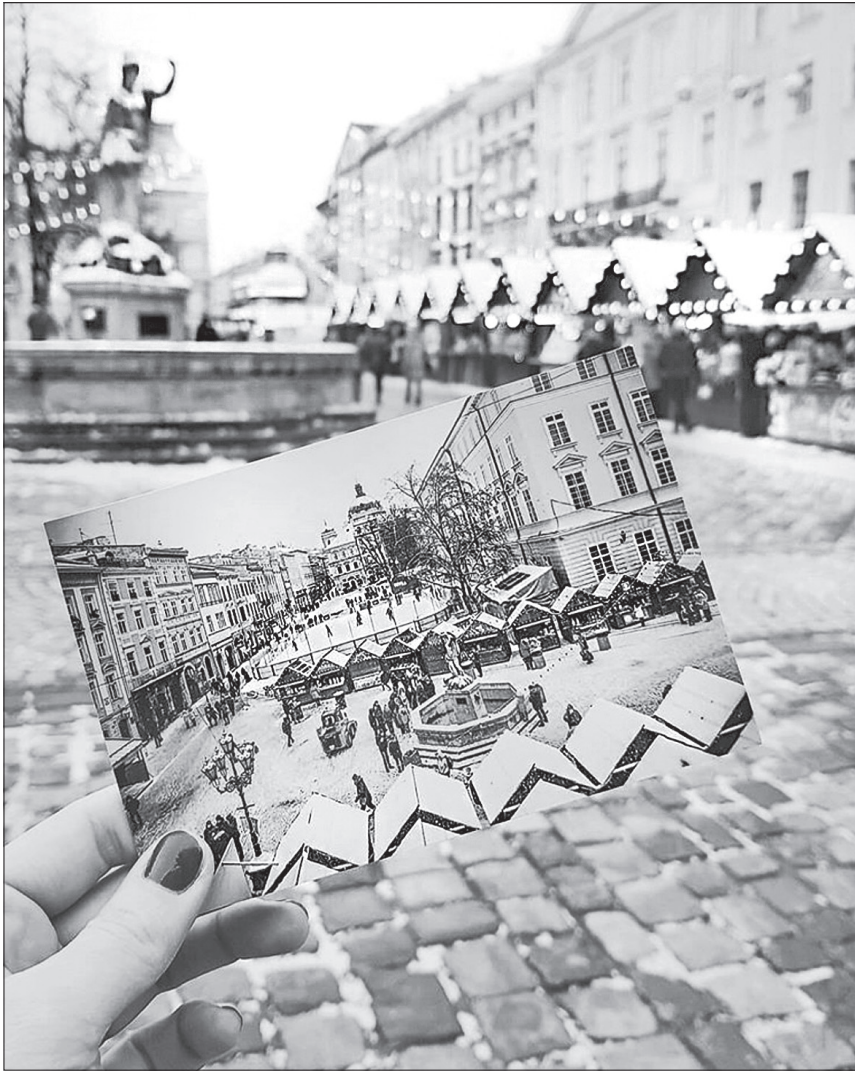
На площі Ринок різдвяний ярмарок очікує гостей

Під час церемонії запалення головної ялинки Львова пластуни передадуть гро-