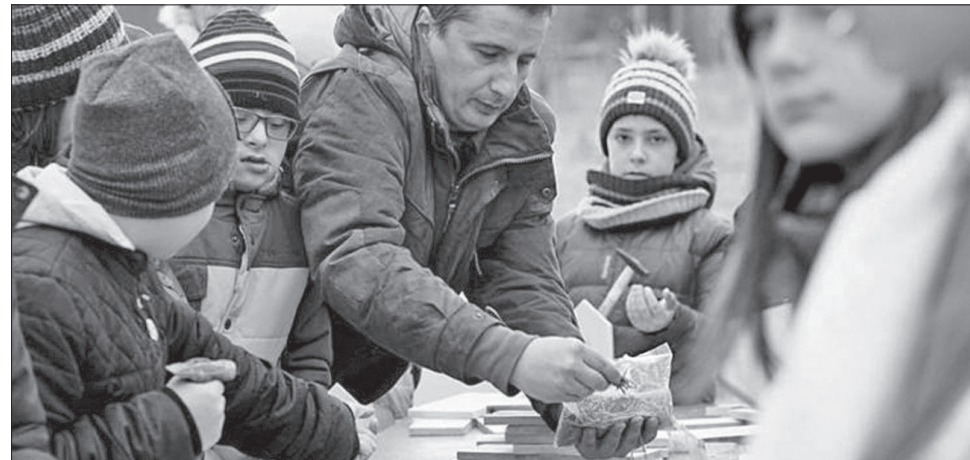
Дорослі і діти разом будують годівнички для птахів

Лісівники привезли складові годівничок — вирізані за розмірами дощечки, щоб дати змогу дітям самостійно