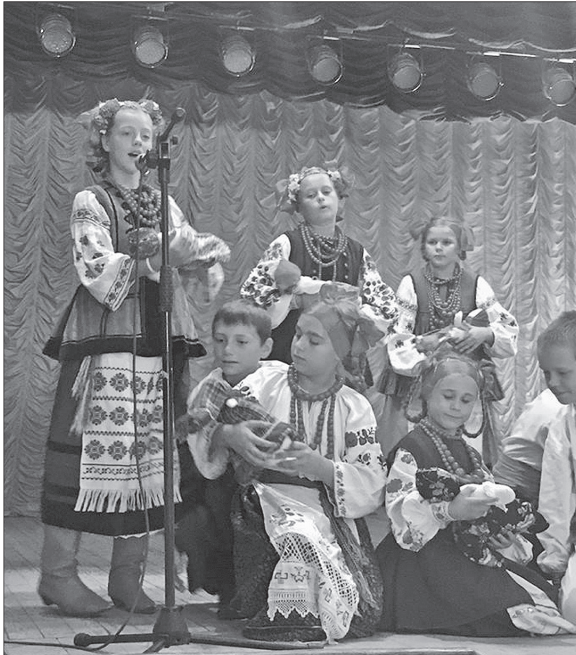
Юні учасники обласного фестивалю народно-го мистецтва «Водіння Куста» добре знаються на обрядових діях