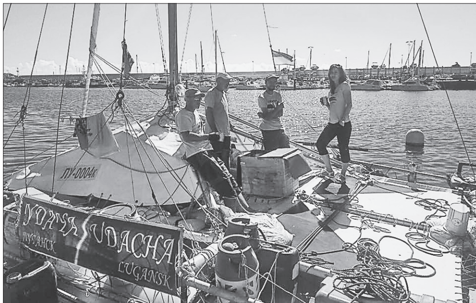
Команда вітрильників зробила перехід протяжністю 6000 кілометрів