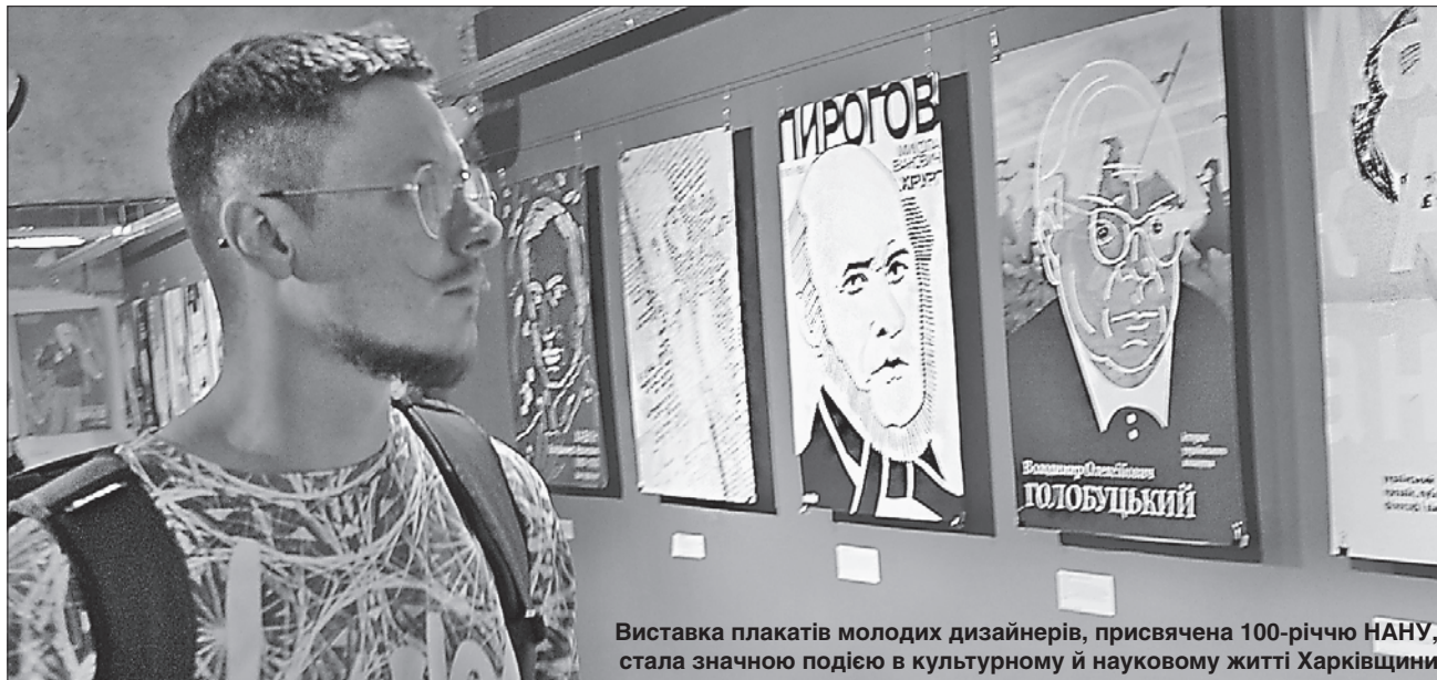
Виставка плакатів молодих дизайнерів, присвячена 100-річчю НАНУ, стала значною подією в культурному й науковому житті Харківщини