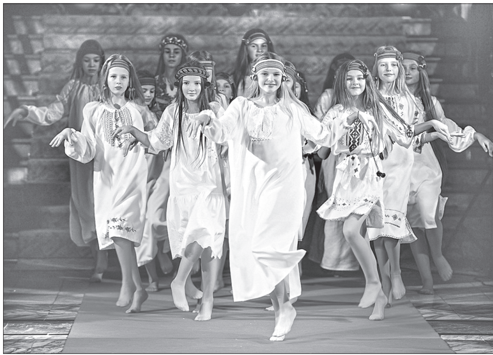
«Із роду в рід»: в Ужгороді провели показ колекції стилізованого народного одягу