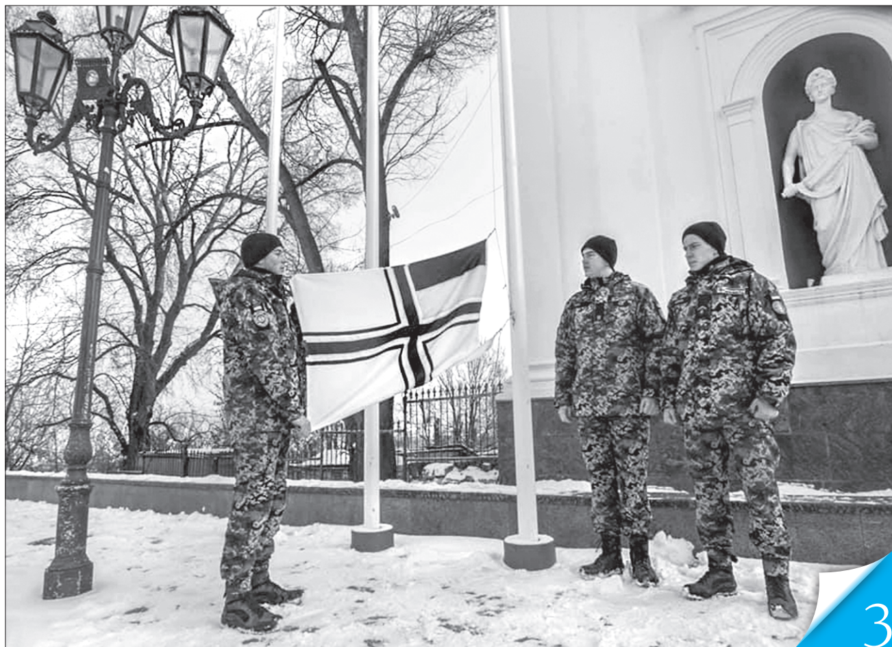
У центрі Одеси на знак підтримки захоплених моряків підняли прапор ВМС

БРАНЦІ КРЕМЛЯ. Світ із тривогою стежить за долею українських моряків, яких захопили в полон російські спецслужби, і закликає Москву повернутися в міжнародне правове поле