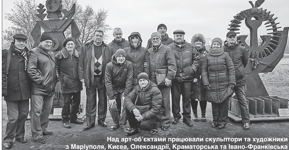
Над арт-об'єктами працювали скульптори та художники з Маріуполя, Києва, Олександрії, Краматорська та Івано-Франківська