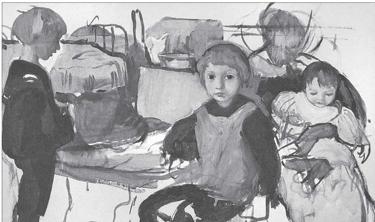
Володимир ГАЛАУР, «Урядовий кур'єр»

ВИСТАВКА. Традиційний конкурс і підсумкова виставка попередніх днів народження видатної художниці Зінаїди Серебрякової відкрилася в Харкові в галереї «Мистецтво Слобожанщини». Тут представлено найкращі зразки живопису, графіки та скульптури сучасних художників за підсумками конкурсу ім. Зінаїди Серебрякової. Цього року темою конкурсу й виставки було обрано «Портрет сім'ї художника в інтер'єрі». У галереї представлено графічні, живописні та скульптурні роботи, виконані в різних стилістичних манерах, у різні роки, з різними автор-