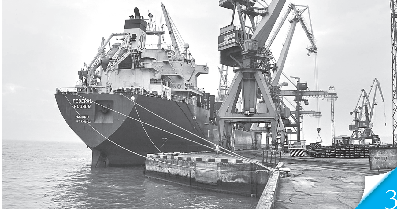
Кораблі стоять у портах, на рейдах, біля протоки, деякі повертаються назад

ПОВЗУЧА АНЕКСІЯ. Агресор перекрив Керченську протоку. Українські порти в акваторії Азовського моря фактично опинилися у блокаді