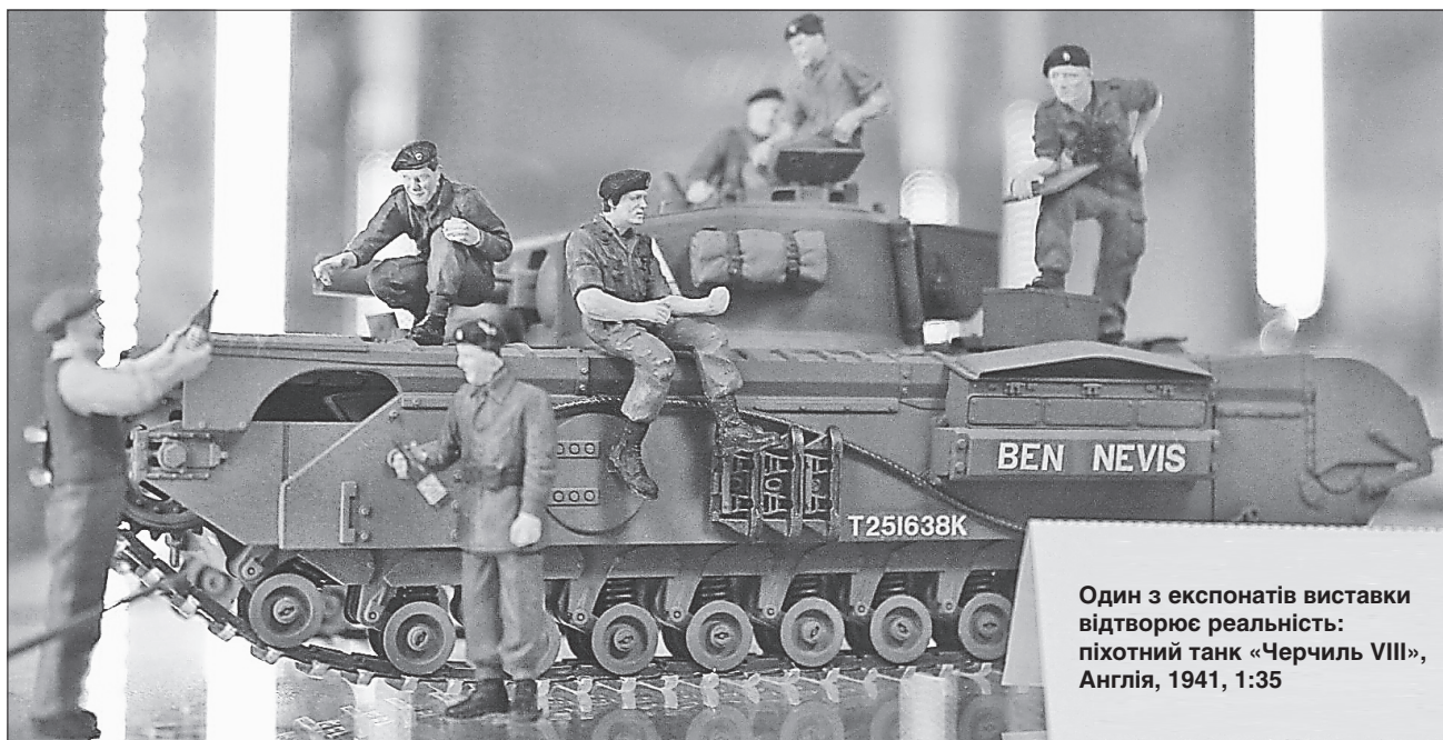
Один з експонатів виставки відтворює реальність: піхотний танк «Черчилль VIII», Англія, 1941, 1:35