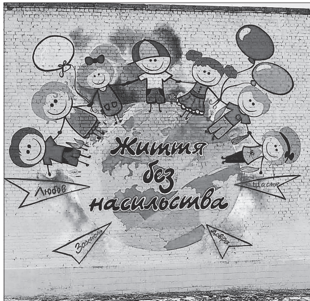
Мурал у Рубіжному, присвячений запобіганню та протидії насильству

Перший мурал на тему «Життя без насильства» у Луганській області постав у Серверодонецьку в 2016 році.