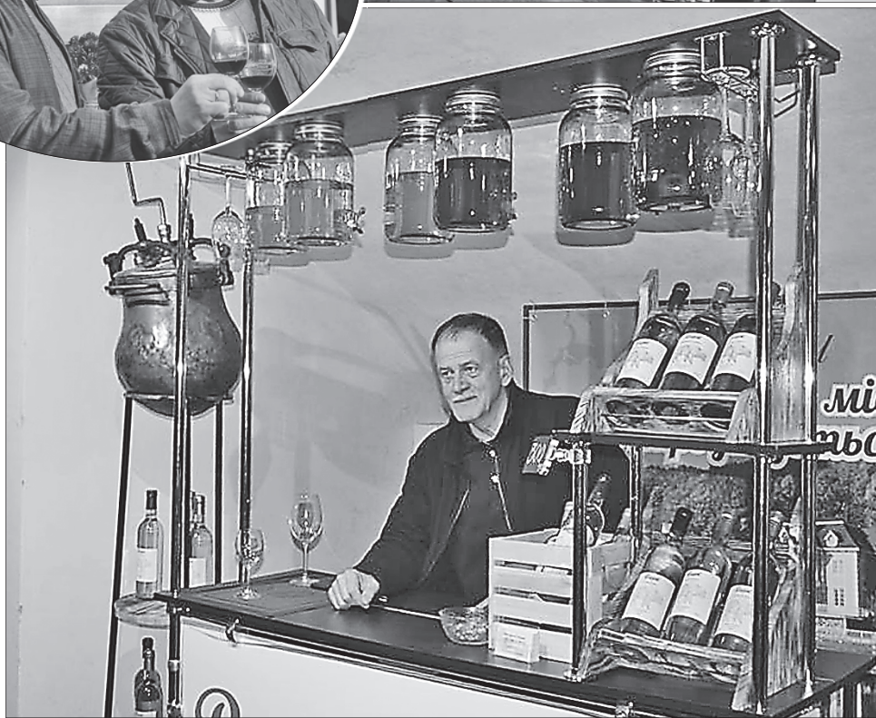
«Закарпатське божоле» — ще й оригінальне оформлення торгового місця