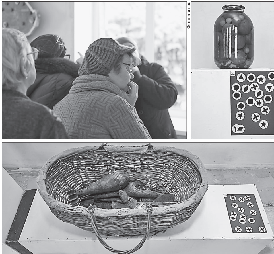
Експозиція викликала жвавий інтерес глядачів