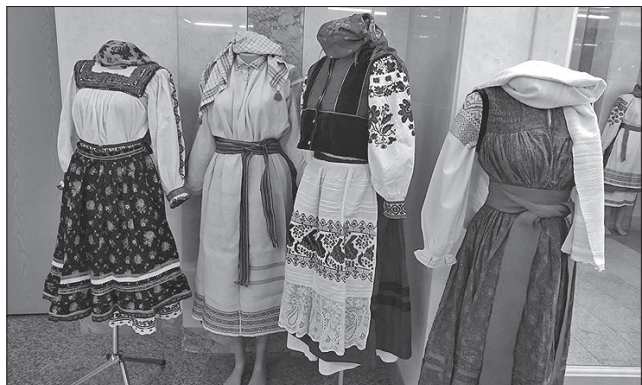
Енергетику стародавнього вбрання можна було відчутти під час майстер-класів

ма, започаткований на Рівненщині торік, має на меті відродити традиції виготовлення та культуру вжитку автентичного одягу, інтерес до якого зростає. А ще він покликаний створити креативний простір для спілкування музейників, мистецтвознавців, етнографів, дизайнерів, приватних колекціонерів задля популяризації костюма, в якому душа наша й доля.