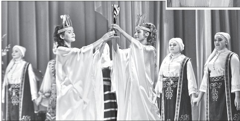
Зазвичай фестиваль грецької культури в Маріуполі збирає велику концертну програму