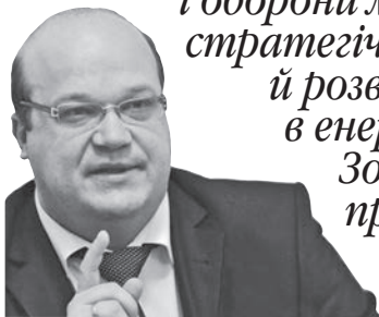
Посол України в США про новий виток партнерства Києва і Вашингтона

ВАЛЕРІЙ ЧАЛИЙ: «У сфері безпеки і оборони ми справді маємо стратегічне партнерство й розвиватимемо його в енергетичній галузі. Зокрема, у спільній протидії обхідним газогонам повз Україну».