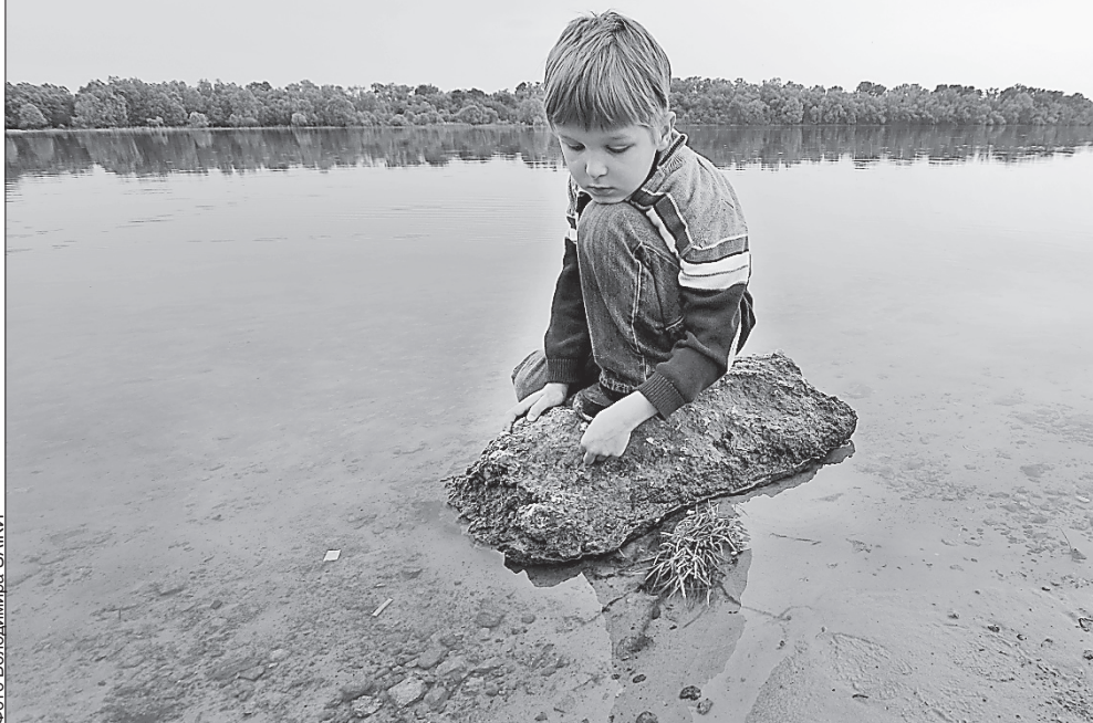
Фото: Володимир ЗАЙКА