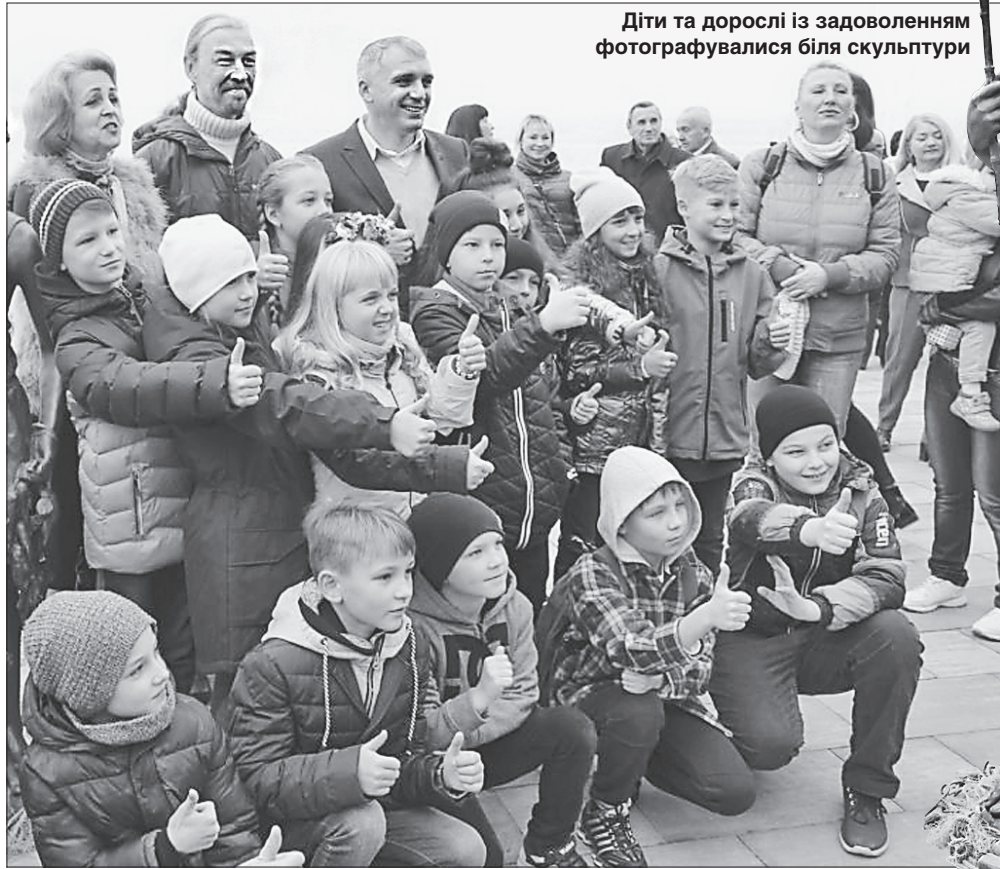
Діти та дорослі із задоволенням фотографувалися біля скульптури

чика-рибалку можна вважати символом Миколаєва, бо він красивий, замріяний у майбутнє, якого ми прагнемо. Він подякував усім, хто реалізував проект. По завершенні урочистостей миколаївці фотографувалися із скульптурою на щастя і за новою прикметою терли вудочку.