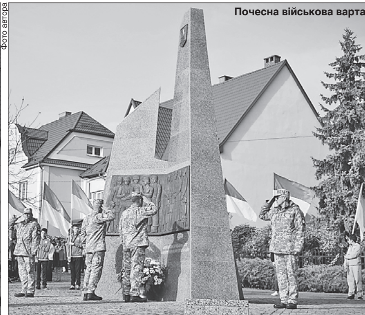
Василь БЕДЗІР, «Урядовий кур'єр»

ВДЯЧНІСТЬ. Днями в обласному центрі Закарпаття віддавали шану воїнам, загиблим у боях на Донбасі. На пагорбі Слави представники всіх релігійних конфесій освятили Меморіал захисникам Вітчизни. У шанобливому мовчанні схилили голови перед пам'яттю загиблих воїнів керівники області й Ужгорода, очільники правоохоронних відомств, добровольці, рідні й близькі.