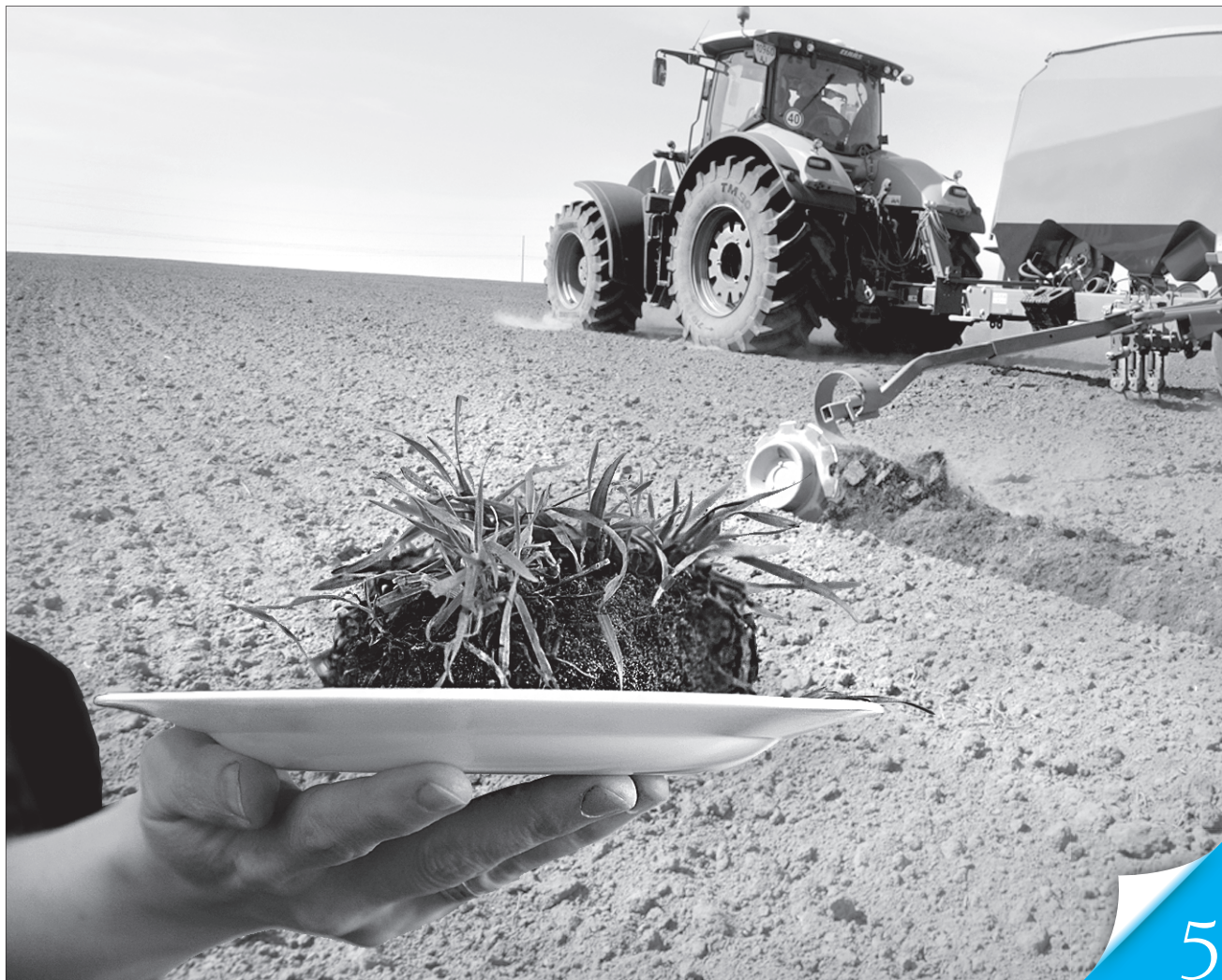
Фотоколлаж Ірини НАЗІМОВОЇ