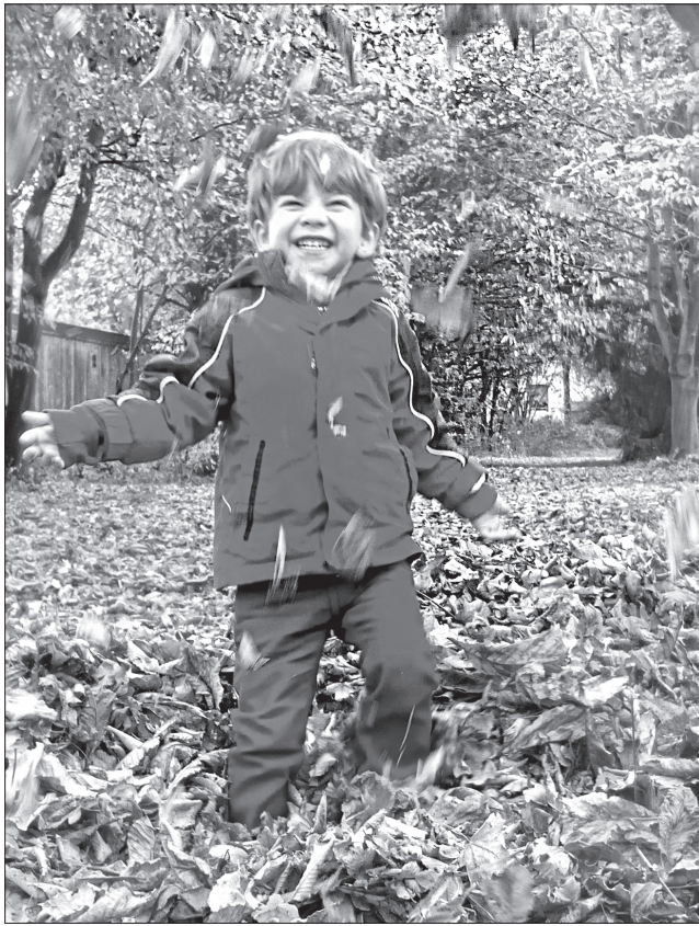
Цього року листопад виправдовує свою назву і радує різнобарв'ям осіннього листя

На Дмитра Солунського — дідів день, починаються поминальні суботи, що тривають до Різдва Христового. Цей обряд — вияв пошани до роду. За народним повір'ям, Дмитро замикає землю на ключі і надає право господарювати на ній зимі до Юрія Весняного (6.05). Якщо цього дня випаде мокрий сніг, увесь листопад буде холодним; якщо день вітряний, снігу не буде до нового року; якщо день вологий, з відлигою — на теплу зиму та ранню весну.