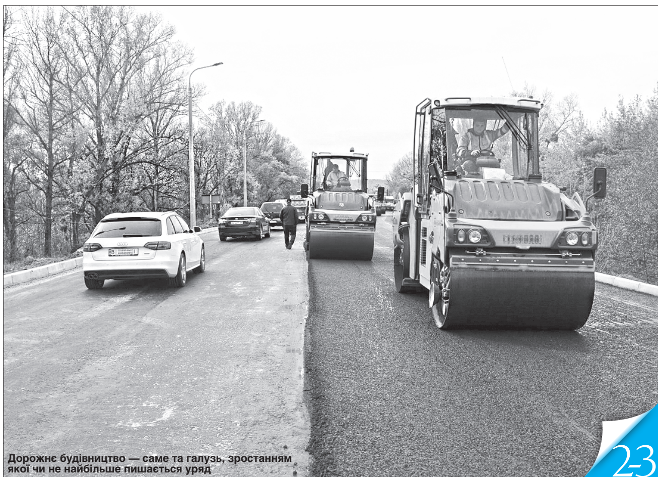
Дорожнє будівництво — саме та галузь, зростанням якої чи не найбільше пишається уряд