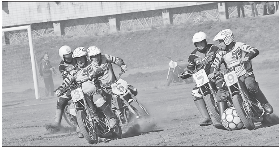
Мотобол — гра мужніх

Державний процес реформування спортивної галузі на Полтавщині проходить за підтримки голови Полтавської ОДА Валерія Головка. Зміни здебільшого стосуються не олімпійських видів спорту, серед яких і мотобол. Суть реформи — у переході на реальну світову практику, тож перші кроки в цьому напрямі Щербанівська ОТГ вже зробила.