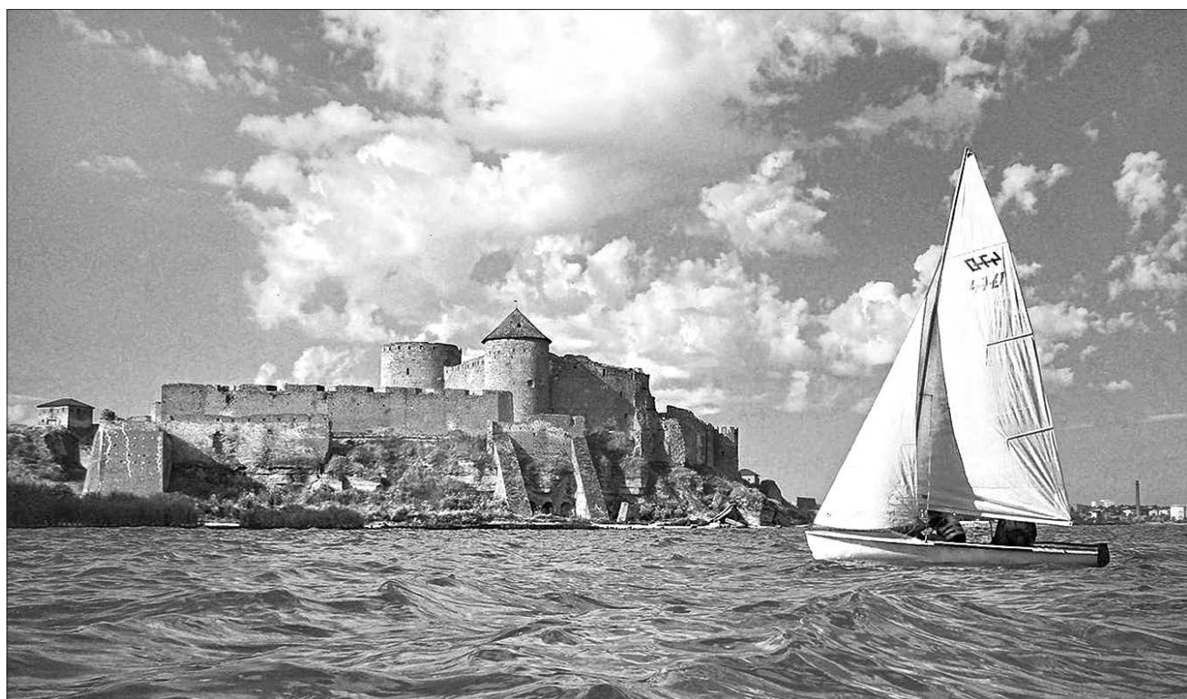
Аккерманська фортеця, розташована в Білгороді-Дністровському, також отримала кошти на оновлення

РОЗВИТОК. Найкращі туристичні та інші проекти за підтримки європейської спільноти й уряду незабаром змінять обличчя регіонів