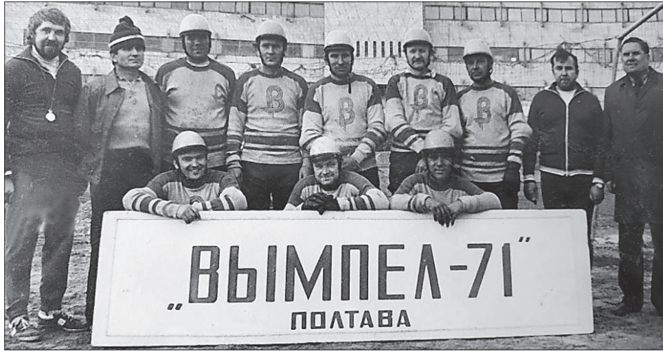
У 1970-х розсошенський «Вимпел» був відомий в Україні

Стадіон у Розсошенцях тривалий час не діяв. Востанне на ньому грали в мотобол 2005 року. Однак із прийняттям його у комунальну власність місцевої ОТГ об'єкт уберезуть від запускання й використовуватимуть