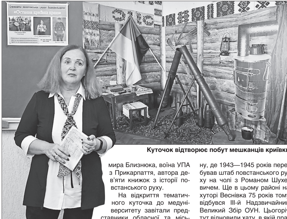
Куточок відтворює побут мешканців криївки