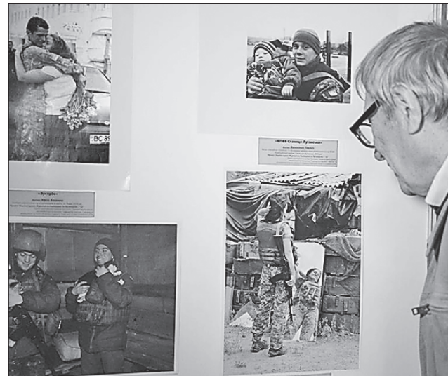
Військові фото не залишають байдужими

Ці та інші його роботи неодмінно мають побачити світ. Фотовиставка працюватиме протягом місяця.