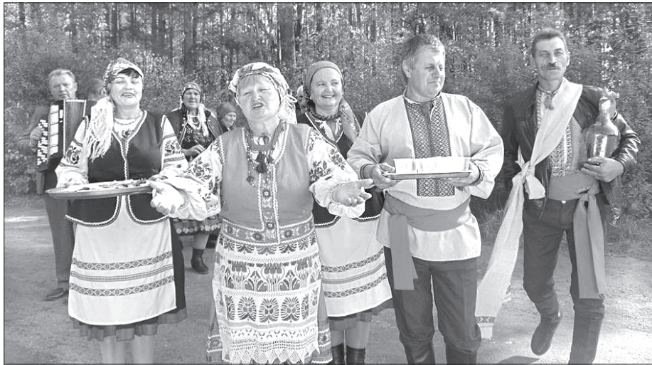
Випікання та вбирання короваю, вирядження молодого й молодої, викуп нареченої, спорядження приданого — все це можна побачити під час фестивалю

Випікання та вбирання короваю, вирядження молодого й молодої, викуп нареченої, спорядження приданого — все це можна побачити на власні очі. Були майстер-класи із ткацтва: чи знаєте, як власноруч виткати весільний рушник? А тут наречені ще й нині самі його тчуть! І все це під колоритний танцювальний супровід народних старовинних танців. Пригощали, зрозуміло, традиційними стравами поліської кухні: куліш із кишкою, гарбузова каша, млинці щойно з печі й, звісно ж, весільний коровай. Охочі тут-таки пройшли майстер-клас із виготовлення прикрас до нього із прісного тіста.