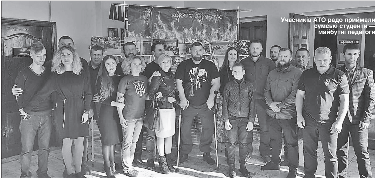
Учасників АТО радо приймали сумські студенти — майбутні педагоги