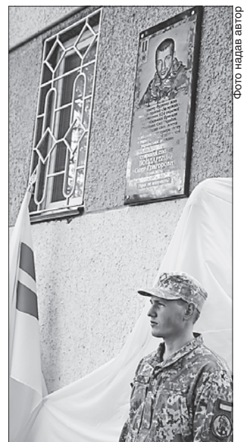
У цьому будинку жив Герой

Цього тижня у навчальних закладах Миколаєва пройшли заходи з нагоди відкриття меморіальних дощок на честь семи воїнів, які віддали життя за свободу і незалежність Батьківщини. Пам'ятні знаки встановили за кошти міського бюджету, відповідно до рішення виконкому міської ради. Цього року планують замовити виготовлення ще восьми меморіальних дощок загиблим Героям.