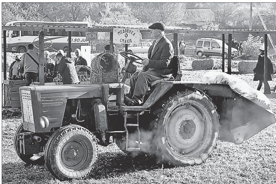
Гарбузи везли на ярмарок трактором-кабриолетом