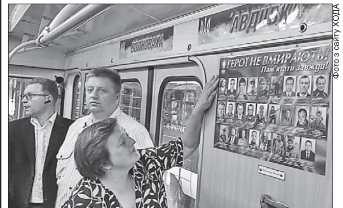
Виставка пам'яті і шани у вагоні Харківського метрополітену

«Тепер надаємо кошти для проведення з'їзду матерів і вдів воїнів АТО і ООС, які зберуться з усієї держави в Харківській області. Передбачено гроші на реконструкцію скверу Захисників України, де з'явиться пам'ятник усім воїнам», — розповів заступник керівника області.