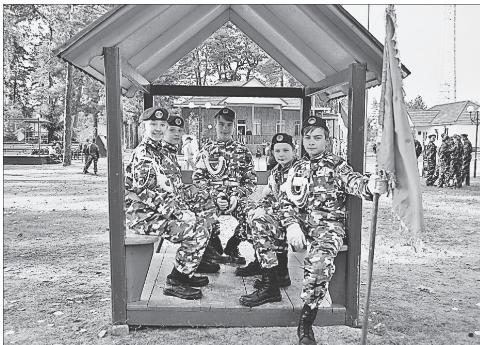
У складі команд хлопці й дівчата

Найкращих відзначили грамотами департаменту освіти і науки Полтавської облдержадміністрації, призами і грошовими винагородами: 3000 гривень — за I місце, 2000 — за II, 1000 — за III місце.