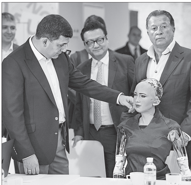
Робот Софія вразила Прем'єра обізнаністю про нашу країну

технологічні ідеї, які ще 15—20 років тому можна було побачити хіба в кіно. «Настає час нових технологій, нових знань, нових компетенцій», — сказав Володимир Гройсман. — І наше завдання — зробити так, щоб у новій українській школі кожна дитина могла розкрити свій потенціал. Діти в школу мають іти не як на випробування, а із задоволенням і заохоченням». Прем'єр наголосив, що більшість світових технологічних новинок мають українську складову. І цей інтелектуальний капітал потрібно спрямувати на створення кінцевого продукту в Україні. «У всіх провідних розробках світу є частина українського інтелекту. Настав час, щоб і в Україні створювати продукт. Це важливо. Ма-