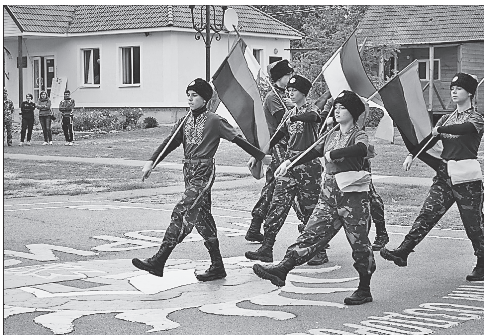
Соколята з Миргорода