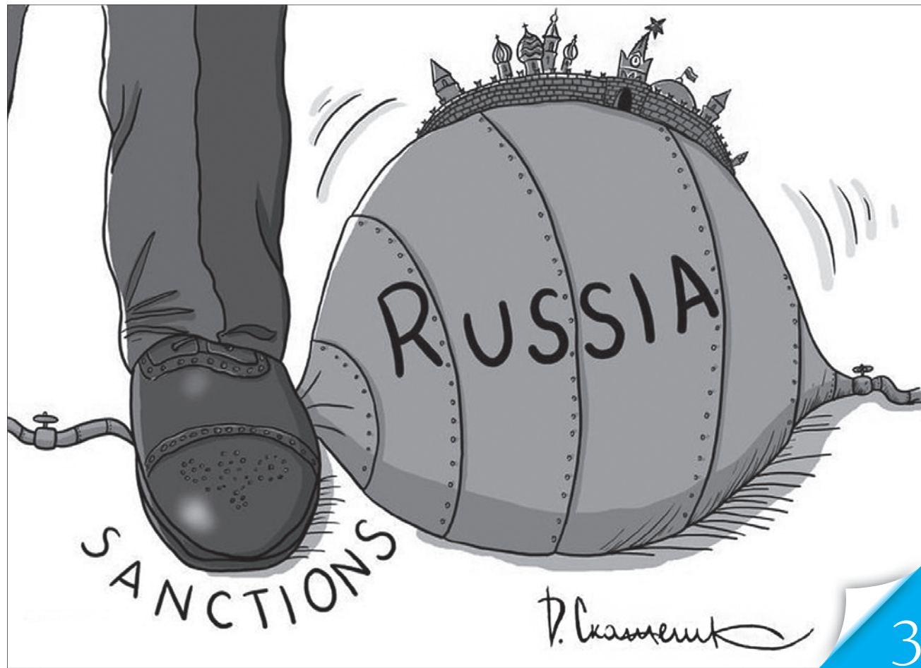
Карикатура з сайту youreporter.it