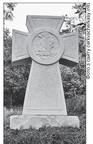
Хрест козацької слави нагадує кожному про наших пращів великих

Учасники робочої наради, яку провела обласна державна адміністрація поблизу села, були одностайними в тому, що любов до України, пам'ять про її героїчну минувшину, відповідальність перед сучасниками й нащадками мають спонукати до конструктивних дій. Викладачі та студенти Черкаського національного університету ім. Б. Хмельницького, приміром, впорядкували певну територію. А козацький хрест покликаний нагадувати всім, яке це знаменне місце для кожного українця.