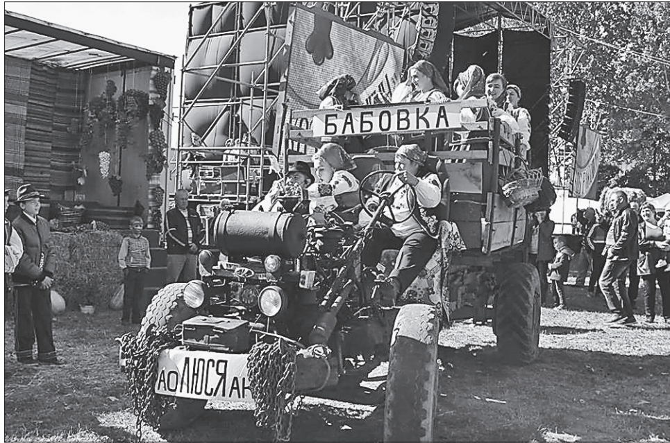
Вокальний ансамбль Бобовищенського будинку культури «Бабовка» виступав... на тракторі

Голова облдержадміністрації Геннадій Москаль не оминув увагою пекучих проблем закарпатського промислового виноробства. За його словами, розвиток галузі гальмує небажання на законодавчому рівні розв'язати проблему колишніх винрадгоспів, до яких належить і агропромислове торговельне підприємство «Бобовище». «Теперішній фестиваль свідчить про перспективність цієї галузі на Закарпатті й у цьому селі, яке має всі передумови, щоб