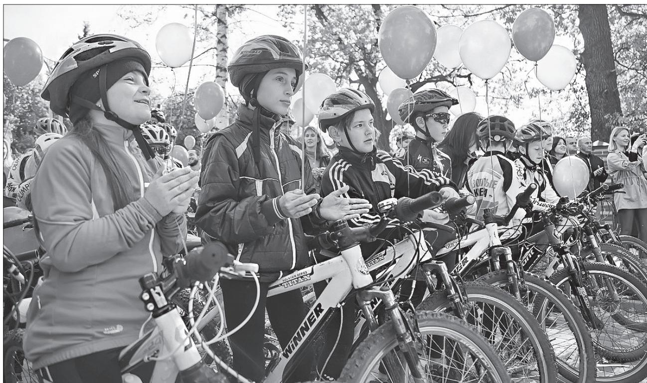
Відкриття нового — завжди свято, а такого сучасного велоцентру — особливе

Велоцентр функціонуватиме цілий рік. Тут працюватиме служба технічної допомоги з ремонту велосипедів. Власники двоколісних машин можуть залишити тут їх на зберігання. Любителі покатаються матимуть змогу взяти велосипеди на прокат. У зимовий період велоцентр перекаваліфікується на прокатний пункт лижного спорядження.