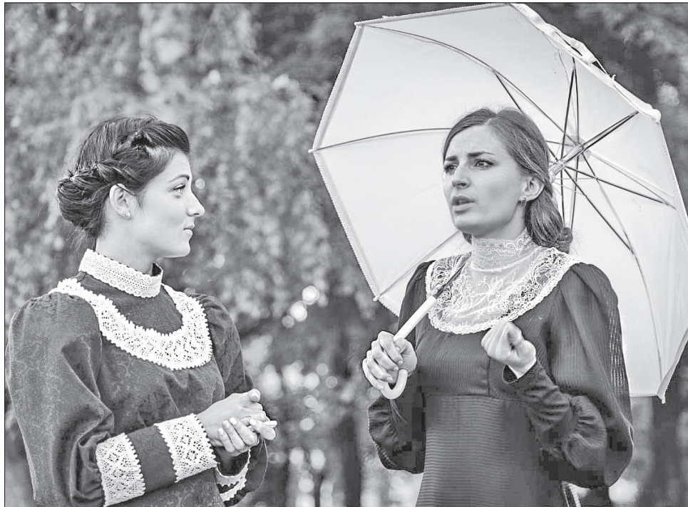
Про життя Володимира Короленка розповідали його доньки Софія та Наталка

Екскурсійний маршрут проходив між двома полтавськими помешканнями Короленка — будинком Петра Старицького (нині будівля СБУ) та будинком на Мало-Садовій, де минули останні 18 років життя письменника й громадського діяча. На цьому маршруті було створено сім локацій, де екскурсанти мали змогу почути цікаву інформацію про об'єкти, пов'язані з життям і діяльністю Володи-