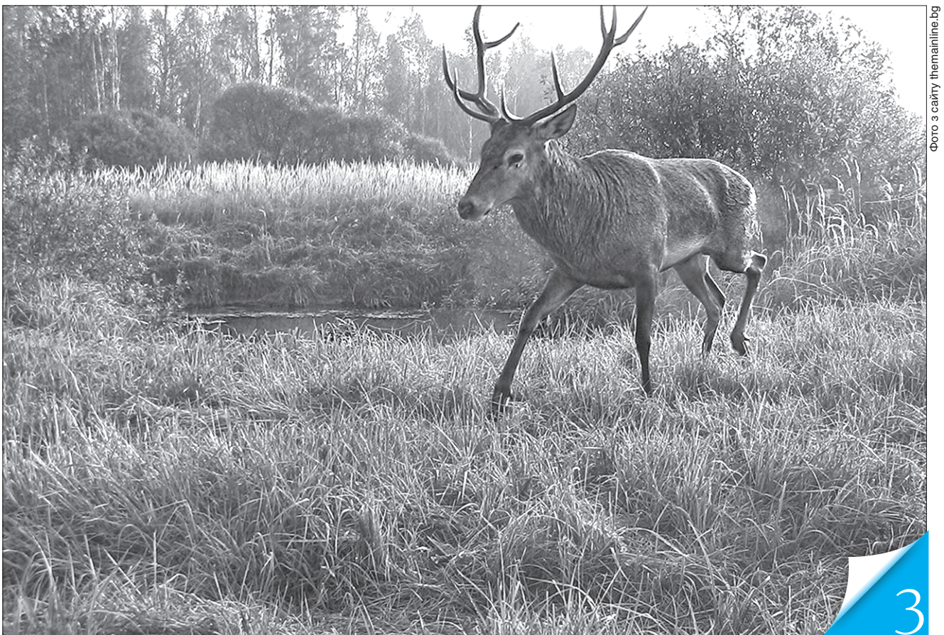
Сьогодні в заповіднику живуть тварини, які з'явилися тут через багато років

ПЕРСПЕКТИВА. Про унікальний біосферний заповідник і втілення там новітніх інженерних рішень розповів голова Державного агентства з управління зоною відчуження Віталій Петрук