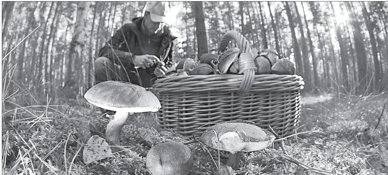
Сподіваємося на добрий врожай грибів нинішньої осені

ТРАДИЦІЇ. До свята Сергія-Капустяника господині печуть на листах королеви грядок хліб і пироги