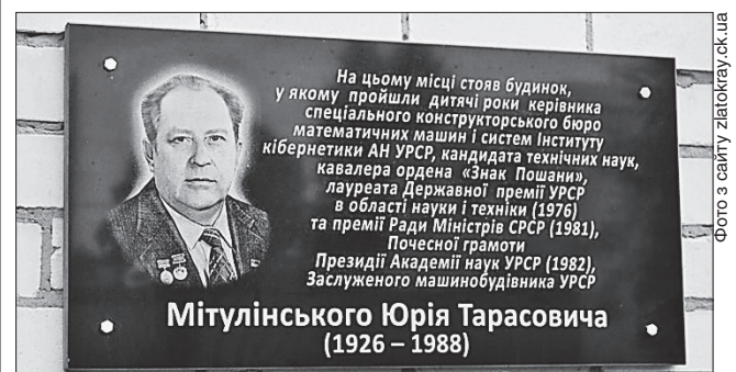
Щойно відкрита меморіальна дошка в Золотоноші

Свою посаду Мітулінський обіймав 20 років. Було чимало великих звершень і перемог, серед яких і забезпечення управління космічним польотом «Союз—Аполлон». За час роботи Юрій Тарасович брав участь у розробленні комплексу елементів «Мир-1» і «Мир-2», конструюванні та впровадженні першої в СРСР обчислювальної машини «Дніпро». Під його керівництвом створювали відомі серії обчислювальних машин «Київ», «Промінь» та інших. Оpubлікував 22 роботи в галузі обчислювальної техніки.