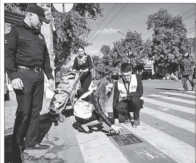
Написи, які патрульні разом зі школярами нанесли на асфальт, одразу впадають в очі

Організатори акції сподіваються, що написи вплинуть на перехожих і прикрих порушень поменшає.