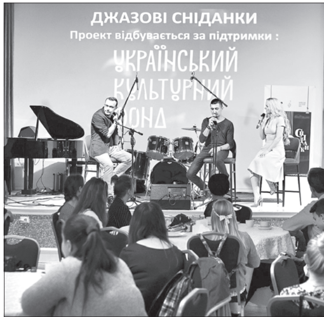
Гості джаз-фесту відчували імпровізацію і насолоду від спілкування й під час новаторського культурно-революційного проекту «Джазові сніданки»

А під час завершального концерту країни і гості міста мали можливість насолодитися виступами джазових колективів з Литви, Південної Кореї та України. Розпочався концерт проектом «Литовські тромбони & Лорета Сунгайлєне» — виступом оригінального секстету тромбоністів і знаменитої литовської співачки-етномузикознавиці Лорети Сунгайлєне. У творчості колективу поєдналися народна і джазова музика, слухачам продемонстрували цікавий сучасний погляд на литовський фольклор. У другому відділенні вперше в Україні виступили джазові зірки Пів-