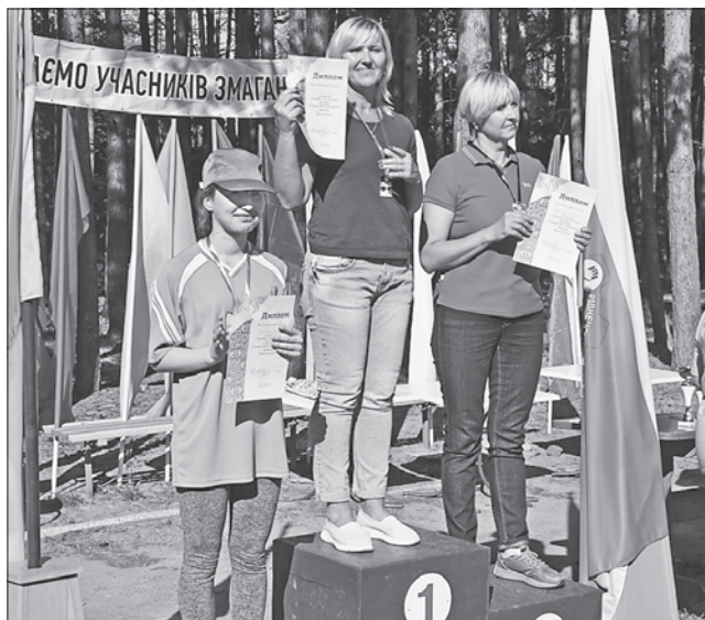
Кращі гравці у настільний теніс отримали заслужені нагороди