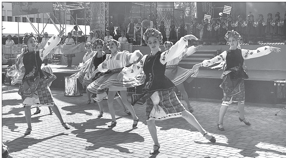
А ввечері полтавців порадували концертною програмою