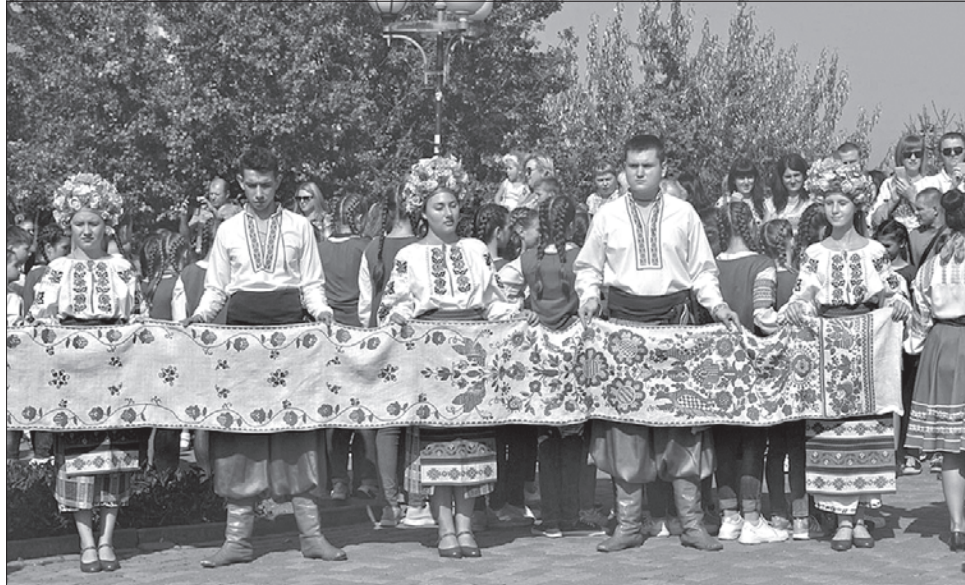
У параді вишиванок узяли участь більше 10 тисяч людей

Напередодні Дня міста в обласному центрі, незважаючи на дощ, пройшов багатотисячний парад вишиванок. «Усі полтавці та полтавки разом із дітьми сьогодні виходять у національному одязі. Ду-