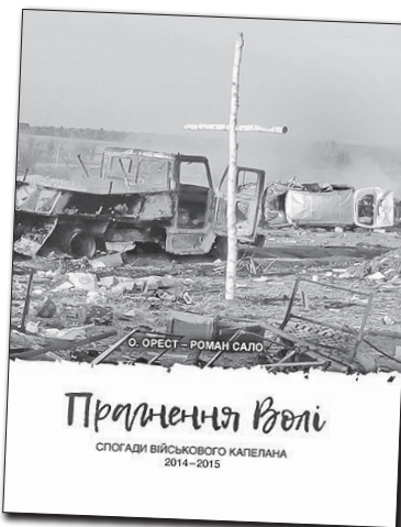
«Прагнення волі» місцева влада Львова визнала кращою книжкою форуму

Чи можливо придбати книжку за адекватною ціною? Нескладний моніторинг засвідчив, що до цінової екілібристики не вдаються ніхто з лівівських видавництв — деякі з них справді пропонують свою продукцію за собівартістю. Але є й такі, хто не нехтує можливістю заробити. Відвертіше про секрети вимушеної бухгалтерії говорили приїжджі видавці: реалізовувати продукцію за собівартістю