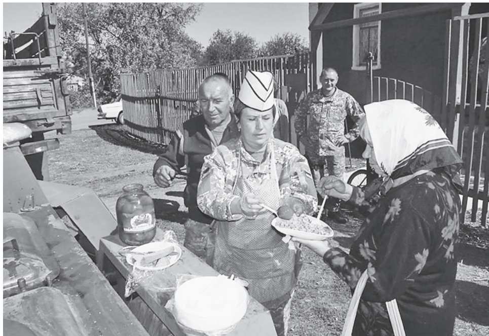
Цього року свято села кримчанам допомогли провести військові

«Напередодні зустрівся з головою військово-цивільної адміністрації селища Кримське, і було вирішено нагальні питання щодо подальшої співпраці та обговорено план