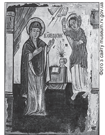
Особливе місце в музеї належить творам волинського іконопису

Нині тут працює небагуджий колектив, який сам творить новітню історію краю. Приміром, на «Музейні гостині», що вже відзначили чверть століття, до Рівного приїздили народні майстри з усієї України. А на початку жовтня в межах міжнародної конференції тут говоримуть про інноваційні технології в музейній, архівній та бібліотечній справах її учасники з України та Польщі. Адже для сусідів-поляків інтерактивні музеї вже не новина, втім, облаштовують їх зазвичай за грантові кошти ЄС.