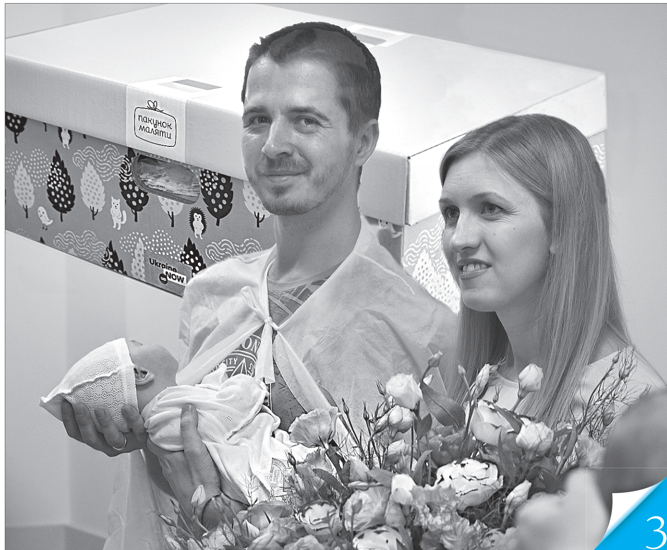
Вересневі немовлята у Запорізькому обласному перинатальному центрі вже обдаровані

СОЦІАЛЬНИЙ ЗАХИСТ. Батьки новонароджених у семи областях почали отримувати пакунки малюка