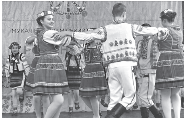
На Закарпатті вміють добре святкувати...

Предки сучасних німців переселялися в далеке від них Закарпаття у пошуках кращого життя. Їхньому приїзду на Мукачівщину посприяв граф Лотар Франц Шенборн-Бухгейм, якому австрійський імпе-