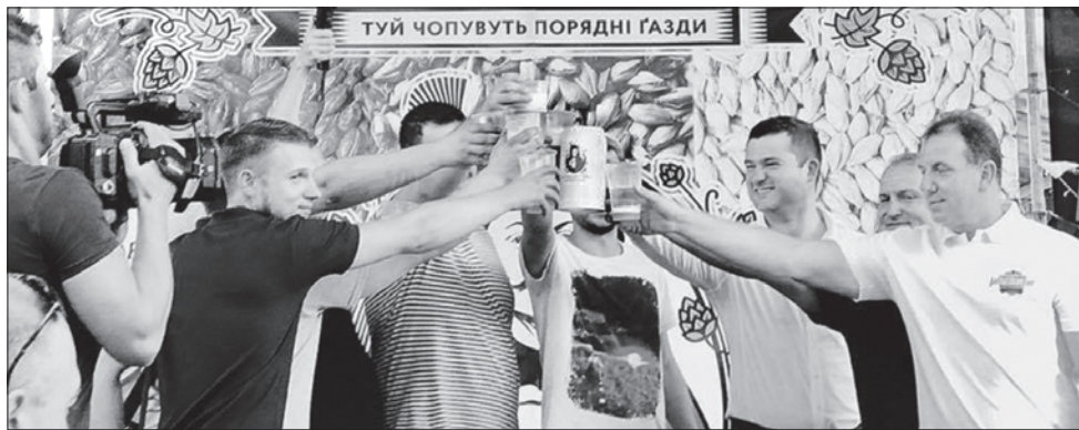
... й виготовляти чудові напої, якими залюбки частують гостей

Етнічні німці Закарпаття під час фестивалю в Мукачеві наголошували: цей край нині для них не друга, як для предків-переселенців, а перша батьківщина. Вони вдячні Україні за можливість розвивати культуру, зберігати звичаї і самотність.