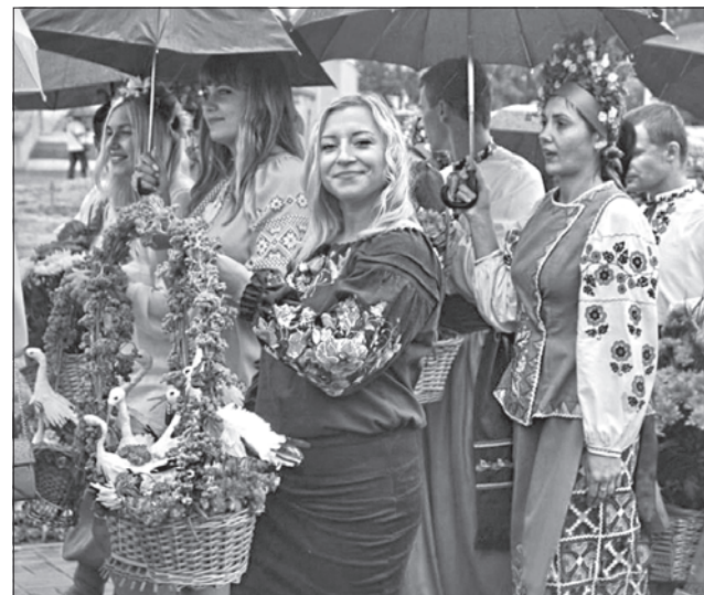
Так крокували вулицями міста учасники фестивалю