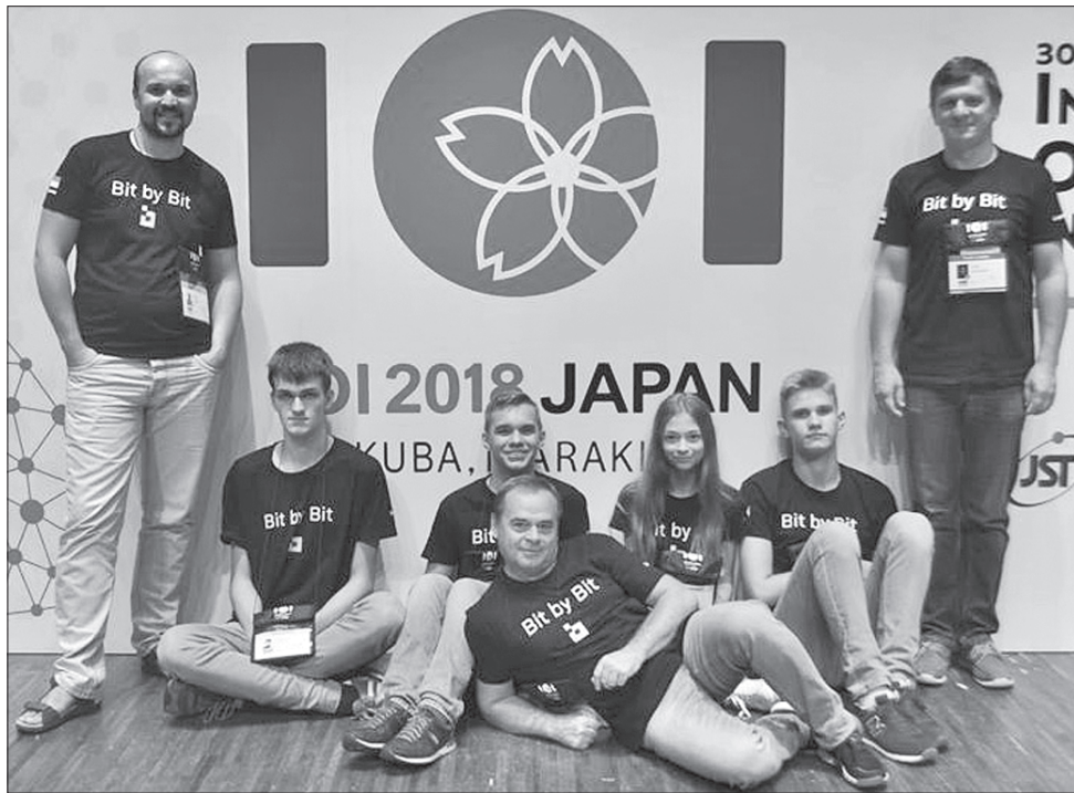
На цьому знімку талановита українська четвірка разом зі своїми викладачами, які готували юних вихованців до олімпіади