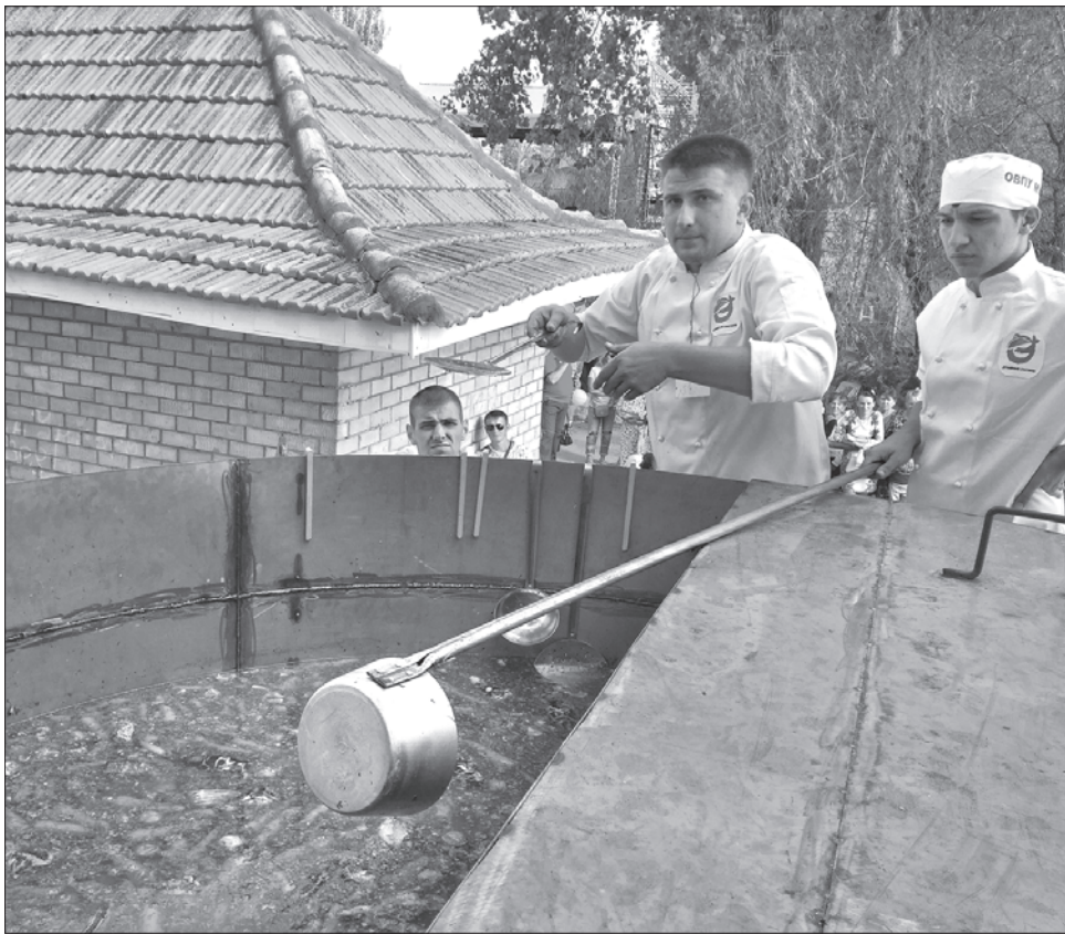
На рекордну юшку використали майже 1700 кілограмів риби

— Ви сказали, що вважаєте розвиток туризму в Одеській області пріоритетним завданням. Для залучення туристів необхідні хороші дороги. І те, що дорогу на Рені