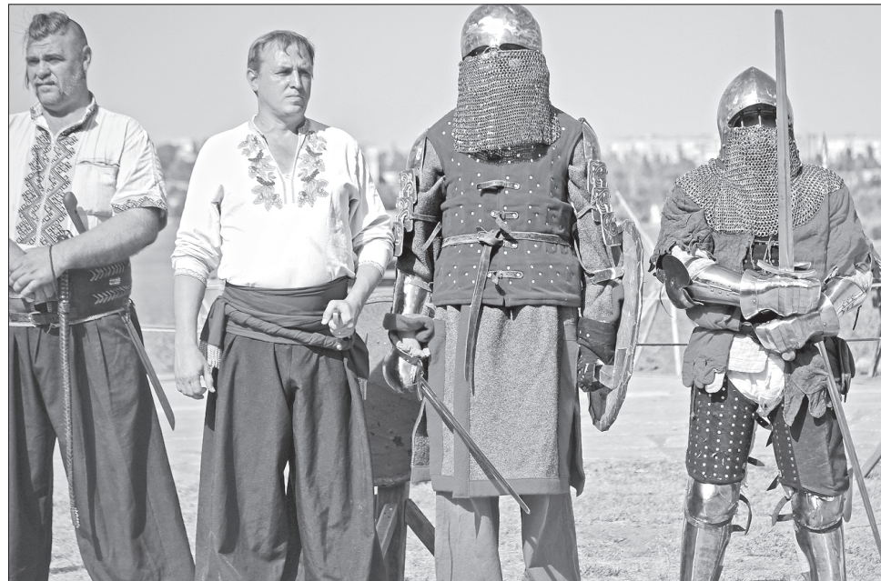
Герої різних епох зустрілися в «Дикому саду»

На думку науковця, новим поштовхом до зростання інтересу громади до розкопок стали масові заходи з нагоди Дня археолога, проведені торік і цього року на території городища. Протягом