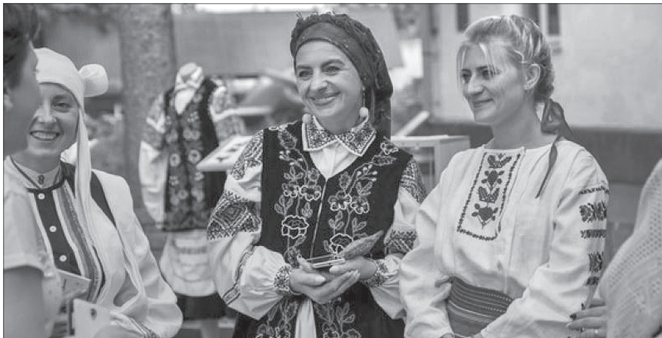
Учасники свята дістали зі скринь автентичний одяг бабусь