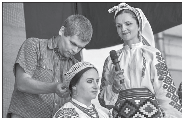
Головний убір — важлива частина національного жіночого костюма

традицій виготовлення і культури вжитку одягу своїх прабабусь. І чого тільки не дістанеш зі старої скрині, яким со-