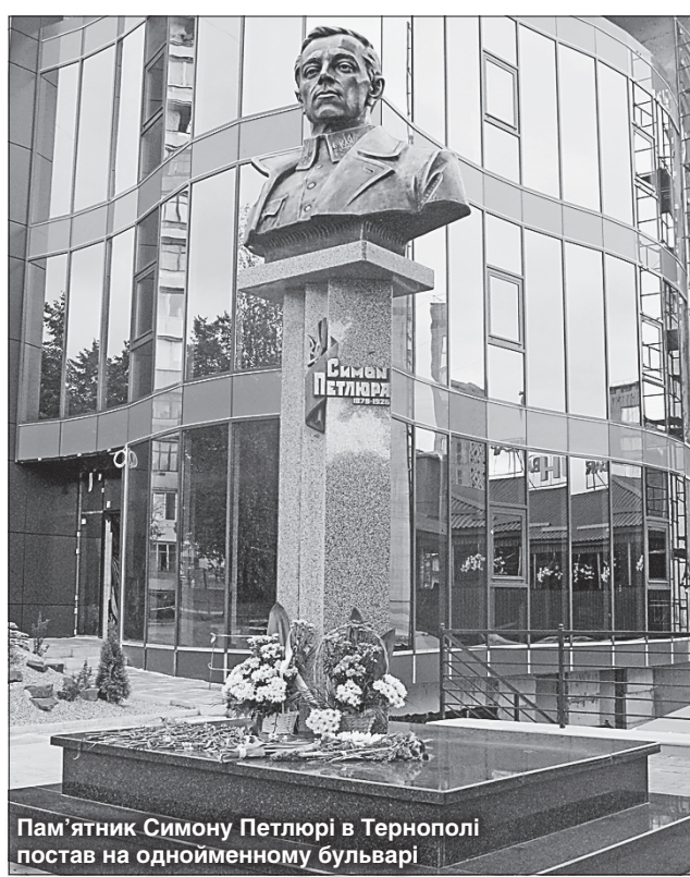
Пам'ятник Симону Петлюрі в Тернополі постав на однойменному бульварі

Автор пам'ятника — тернопільський скульптор Дмитро Пилип'як.