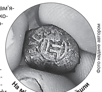
На місці розкопок знайшли татарські монети

Давнє місто розкопують малими силами, але уважно і ретельно. Частина фортеці погано збереглася, бо місцеве населення розібрало її для будівництва власних будинків. Проте археологи продовжують роботи, підсумки яких, безперечно, відкриють нові сторінки історії херсонського краю та України.